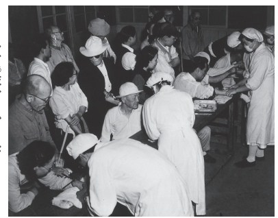
治療薬「プロミン」の注射

ハンセン病患者の隔離政策は、「癩予防法」という法律のもとで進められました。昭和28年（1953年）、患者の反対を押し切ってこの法律を引きつぐ「らい予防法」が成立しました。この法律の問題点は、患者隔離が継続され、退所規定が設けられていないことでした。つまり、ハンセン病患者は療養所に収容されると、一生そこから出ることが出来なかったのです。昭和21年にハンセン病の特効薬「プロミン」が登場し、その後、新しい飲み薬タイプの治療薬が開発され、ハンセン病は適切な治療をすれば治る病気になっていました。にもかかわらず、患者の強制収容が続けられたのです。昭和30年前後から徐々に規制が緩和され、病気が治って自主的に退所する人たちも出てきました。しかし彼らは療養所に入所する際に、社会や家族と断絶させられており、療養所の外では頼る人はなく、救いの手を差し伸べる人も、受け皿もなかったのです。そのような状況の中で、生活苦で体を壊したり、病気を再発させたりして、やむなく療養所に戻る人も少なくありませんでした。