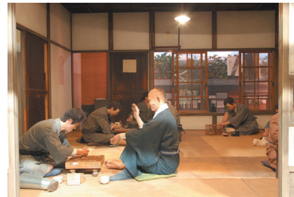
昔の療養所の暮らしが再現されています

全国のハンセン病療養所や国内外の関係機関から収集した資料が数多く展示されています。ハンセン病に関する約30,000冊の図書を収蔵した図書閲覧室もあります。