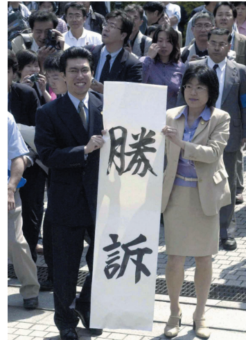
熊本地裁での勝訴発表

熊本地裁判決の日に 原告が勝訴の感動を綴った詩 太陽は輝いた 90年、長い長い暗闇の中 一筋の光が走った 鮮烈となって 硬い壁を砕き 光が走った 私はうつむかないでいい みんなと光の中を 胸を張って歩ける もう私はうつむかないでいい 太陽は輝いた