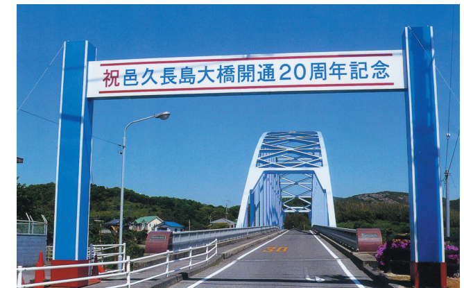
人間回復の橋と呼ばれる邑久長島大橋

長島と対岸の虫明を結ぶ邑久長島大橋は、1988年(昭和63年)に開通しました。隔離する必要のない証、人間回復の証として架橋され、現在は民間バスも乗り入れ、入所者も自由に島外に出かけられるようになっています。