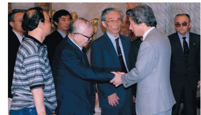
控訴断念するか否かの最終判断をする直前に、ハンセン病訴訟原告代表と面談する小泉内閣総理大臣(当時)

熊本地裁の判決に対し、国は控訴断念を決めるとともに、内閣総理大臣談話を発表し、ハンセン病問題の早期解決に取り組む決意を表明しました。しかし判決後も、熊本県で入所者に対するホテル宿泊拒否事件が起きるなど、残念ながら入所者や社会復帰者、その家族に対する偏見や差別には根強いものがあります。そのため、療養所の外で暮らすことに不安を感じ、安心して退所することができないという人もいます。