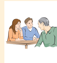
※本名ではない名前

私は12歳で発病し、故郷の愛知県から父親に連れられて療養所に入りました。すぐに本名を俗名※に変えることを勧められました。私の実家は真っ白になるまで消毒され、村八分のように引越せざるをえなかったと後で聞きました。いずれ日本に「ハンセン病の元患者」はいなくなります。しかし、偏見と差別が残るまま、我々の人権が侵されたままでは見過ごせない。そういう思いから、私たちが置かれた境遇を若い人たちに話す機会を大事にしています。つらい病気を経験する人はどの時代にもいます。でも、国の政策や法律によって悲惨な思いをするのは、私たちを最後にしてほしいのです。