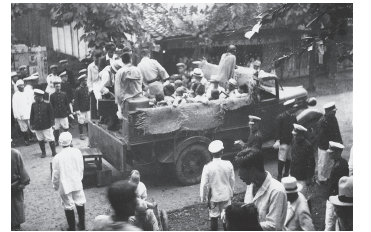
患者の収容には警察官が立ち会った

19世紀後半、ハンセン病はコレラやペストなどと同じような恐ろしい伝染病であると考えられていました。当初は、家を出て各地を放浪する患者が施設に収容されましたが、やがて自宅で療養する患者も収容されるようになりました。ハンセン病と診断されると、市町村や療養所の職員、医師らが警察官を伴ってたびたび患者のもとを訪れました。そのうち近所に知られるようになり、家族も偏見や差別の対象にされることがあったため、患者は自ら療養所に行くより仕方ない状況に追い込まれていったのです。このような状況のもとで、昭和6年(1931年)にすべての患者の隔離を目指した「癩予防法」が成立し、療養所の増床が行われ、各地にも新しく療養所が建設されて行きました。また、各県では「無癩県運動」という名のもとに、患者を見つけ出し療養所に送り込む施策が行われました。保健所の職員が患者の自宅を徹底的に消毒し、人里離れた場所に作られた療養所に送られていくという光景が、人々の心の中にハンセン病は恐ろしいというイメージを植え付け、それが偏見や差別を助長していったのです。