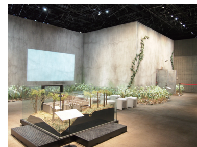
縮尺1/20の模型(手前)と実寸大で部分再現された重監房

また、ガイダンス映像や証言ビデオなどの映像が見られるほか、歴史パネルや実物資料を展示したコーナーなどがあります。