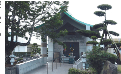
星塚敬愛園の納骨堂

高齢や後遺症、周囲の偏見などを乗り越えて、療養所を退所して社会復帰した人もいますが、その数は決して多いとはいえません。療養所に入所したときに、家族に迷惑が及ぶことを心配して本名や戸籍を捨てた人もいるため、現在も故郷に帰ることなく、肉親との再会が果たせない人もいます。療養所で亡くなった人の遺骨の多くが実家のお墓に入れず、各療養所内の納骨堂に納められています。